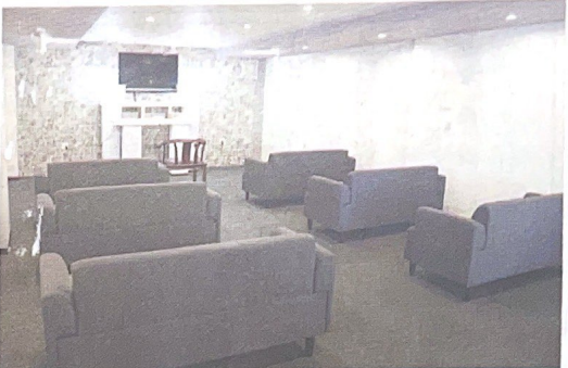
【家族葬などに対応できるセレモニーホール彩雲】

彩雲も完成。樹木葬の料金は個別プラン（2霊用）22万円、合祀埋葬（1霊のみ）11万5000円など。「安心の永代供養も可能で、将来の子孫の負担を減らし、跡継ぎの心配がない新しい時代のお墓のご提供です。詳細はお問い合わせください。か、QRコードからホームページをご覧ください」と呼びかけている。問い合わせはフリーダイヤル0120・401940まで。ホーム